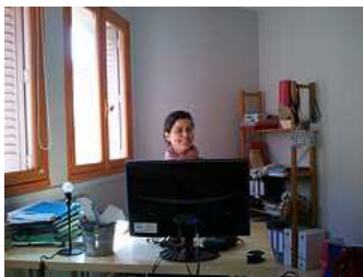
Entrée de la Fabrique à Liens – Janvier 2012

De juillet 2011 à octobre 2011, la recherche de nouvelles structures est activée à travers la rédaction d'une annonce diffusée dans les réseaux de chaque association et auprès d'une quinzaine de structures et acteurs relais repérés par la commission de travail (CRIJ, Rhône-Solidaires, Lyon Campus...).