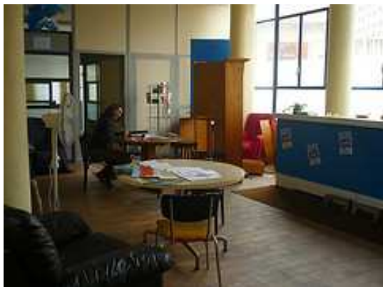
Le hall d'accueil après le chantier bénévole d'aménagement de l'espace- Mars 2012

Quelques difficultés d'ordre technique ont été rencontrées lors de l'entrée dans les locaux, le retard pris par OVH pour l'installation des Telecom et Internet étant la plus symptomatique de ces difficultés. En effet, elle a été un véritable obstacle au travail des structures résidentes, a constitué un frein à l'emménagement de certaines d'entre elles et est l'un des facteurs qui a poussé l'association Savoir-Faire et Découvertes de se retirer du projet.