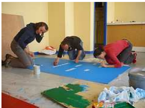
Chantier signalétique - Mars 2012

A ceci s'ajoute le chantier « signalétique » organisé par la commission communication et réalisé les 24 et 25 mars 2012 par les membres de Locaux Motiv'.