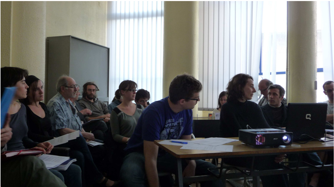
Assemblée Générale de Mars 2012

Néanmoins, il ne faut pas perdre de vue le besoin que Locaux Motiv' apporte publiquement la preuve de cette pertinence et de sa viabilité. Locaux Motiv' est un projet pilote, qui ne possède pas d'équivalent comparable, au moins au niveau local. Ceci est à l'origine d'une certaine complexité dans le pilotage général du projet et dans sa transmission. Il semble que cela représente un volet important des chantiers à venir pour l'année en cours, afin de permettre l'appropriation du projet par l'ensemble de ses membres en interne et de convaincre les partenaires du projet de sa pertinence et de leur intérêt à y apporter un soutien actif.